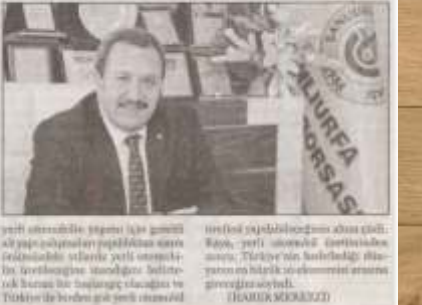
Şanlıurfa Ticaret Borsası

Şanlıurfa Ticaret Borsası Meclis Üyeleri ve Disiplin Kurulu üyeleri Türkiye Odalar ve Borsalar Birliği (TOBB) 73. Genel Kuruluna katıldı. Şanlıurfa Ticaret Borsası Meclis Üyeleri ve Disiplin Kurulu üyeleri Türkiye Odalar ve Borsalar Birliği (TOBB) 73. Genel Kuruluna katıldı.