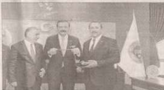
Hisarcıkloğlu, geçtiği son yılların zorlu sürecini

AA/Türkiye Odalar ve Borsalar Birliği (TOBB) Başkanı R. Hisarcıkloğlu, Türkiye'nin büyümeyle devam edeceğini belirterek, "Türkiye'deki işsizlik oranına bakarsanız zaman ille 3 ayda Türkiye'de 760 bin yeni iş imkanı ortaya çıkmış. Bu yeni iş sahalarının açıldığını en somut göstergesi. Bu durum Allah için vermiş bu seneyi Türkiye'nin büyük bir büyümeyle