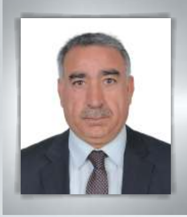
Ömer EYYÜPOĞLU Meclis Başkanı